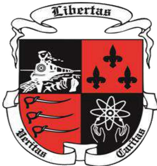
Ilustración 1. Escudo del Colegio Albania

El escudo del Colegio Albania tiene las siguientes características y significados: