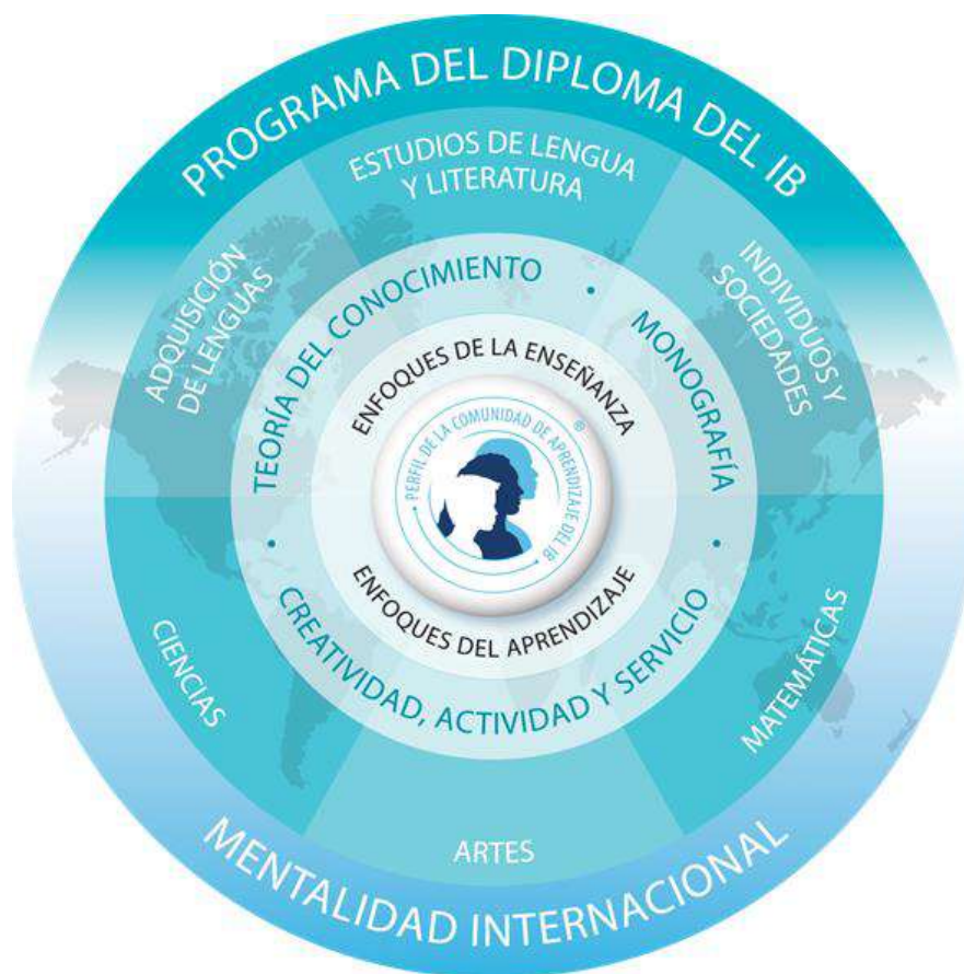
Ilustración 5. Modelo del Programa del Diploma PD 12