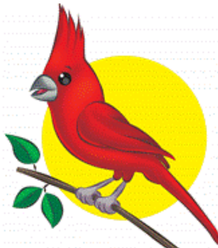
Ilustración 2. Mascota del Colegio

Esta hermosa ave Guajira llama la atención por su hermoso color rojo vivo y su melodioso canto, así como por su copete en forma de corona.