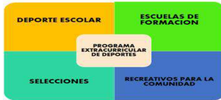
Ilustración 7.Frente de acción