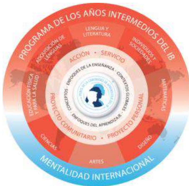
Ilustración 4. Modelo del Programa de Años Intermedios PAI 10

Personal y el Proyecto Comunitario. (Ver ilustración 4)