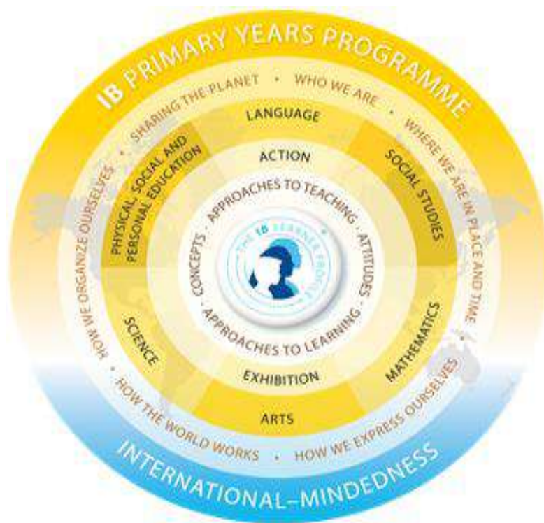
Ilustración 3. Modelo Del Programa de la Escuela Primaria PEP 7